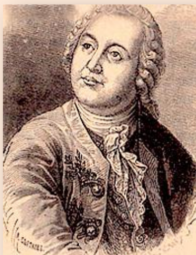
Ломоносов, первый русский поэт и учёный.

церквах после царской фамилии, приходил в негодование и громко роптал. Бирон же думал господствовать ужасом. Шпионы его ходили по городу и захватывали всех подозрительных людей, которых пытали и ссылали, или казнили. Дело дошло до того, что жители Петербурга боялись выходить на улицы, обставленные пикетами и рогатками. Даже родители младенца императора, оскорблённые Бироном, собирались выехать из России. Наконец Россию избавили от ужасов Бироновского правления фельдмаршал Миних. С согласия матери императора, Анны Леопольдовны, он отправился ночью (с 8-го на 9-ое ноября 1740 г.) с отрядом солдат во дворец, в котором жил Бирон, и арестовали его. Бирона сослали в Сибирь, в город Пелым. Но едва только он успели приехать туда, как произошёл новый переворот. По свержению Бирона правительницею объявлена была мать императора, Анна Леопольдовна. Между тем взоры русских людей давно уже обращались дочери Петра I, Елизавете Петровне. Наконец через год в 1741 г., она и была возведена на престол и царствовала 20 лет (до 1761 г.). В её царствование особенно прославились два замечательных человека — Ломоносов и И.И. Шувалов.