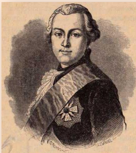
Иван Иванович Шувалов, первый русский меценат или покровитель наук и искусства.

отпустила большую сумму денег на его похороны. Вскоре граф Воронцов поставил за свой счёт над могилою его богатый мраморный памятник. Сын Екатерины II, император Павел I, освободил от подушного оклада и от рекрутской повинности родственников Ломоносова крестьянского звания. При императоре Николае I Ломоносову поставлен памятник в Архангельске, откуда он был родом. При Александре II праздновался столетний юбилей смерти Ломоносова. По этому случаю император повелел учредить премию, т. е. ежегодно отпускать тысячу рублей, за лучшую книгу на русском языке, чтобы на вечные времена утвердить память о Ломоносове в сердцах, русских людей. Наконец сама Денисовка, где Ломоносов родился, переименована в Ломоносовку. Но не в одной России заслужил такую славу Михаил Васильевич. Ещё, когда он был жив, имя его прогремело по всей Европе; многие знаменитые учёные и писатели, французские и немецкие считали за честь познакомиться с ним, если не в лицо, то по письмам; некоторые иностранные академии сделали его своим членом.