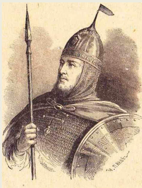
Святой Александр Невский. победитель шведов на берегах р. Невы.

ненавистных, и убивали. Но тогда обыкновенно постигала его ещё горшая участь; появлялись татарские войска, избивали непокорных, а имущества и дома их разграбляли и истребляли до тла. К счастью, татары не вмешивались во внутренние дела русского народа. Как народ полукочевой, привыкший жить в степях со своими огромными стадами скота, они довольствовались только покорностью и данью; управляли же народом по-прежнему свои русские князья. Поэтому народные наши обычаи, вера и язык сохранились в целости, а это дало возможность русскому народу впоследствии соединиться, составить одно государство и свергнуть с себя ненавистное иго монгольское.